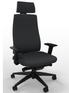
2D-Armlehnen optional: 4D-Armlehnen