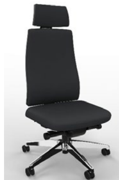
optional: Fußkreuz Aluminium poliert