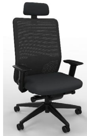
2D-Armlehnen optional: 4D-Armlehnen