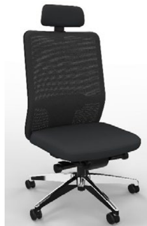
optional: Fußkreuz Aluminium poliert