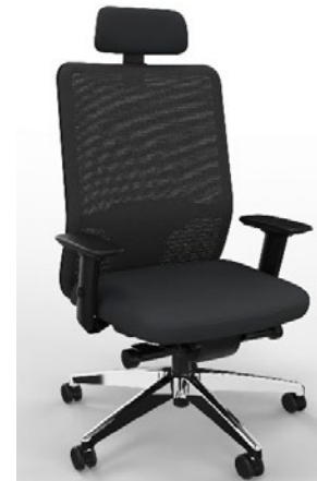
optional: Fußkreuz Aluminium poliert